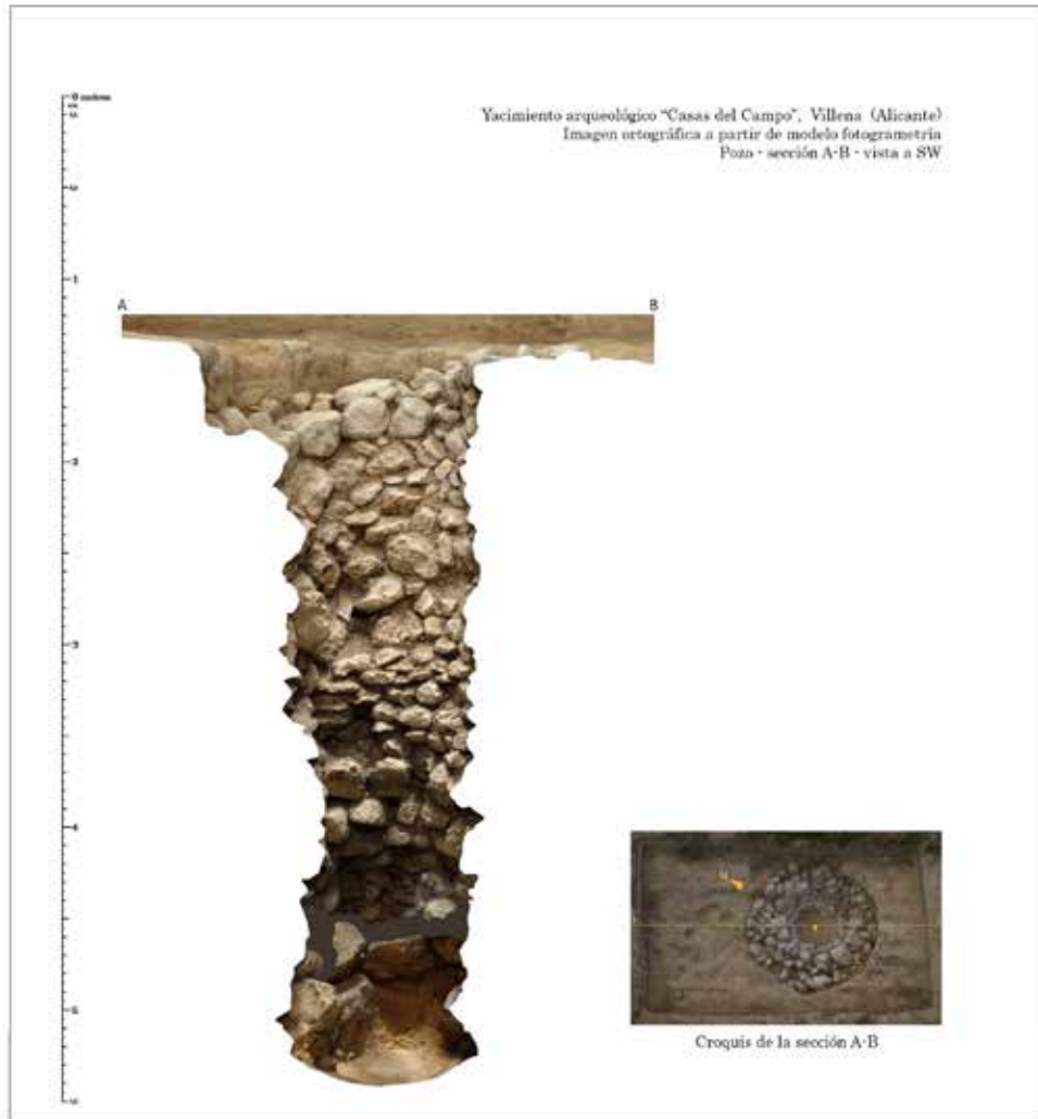
Fig.5. Sección y planta del pozo. Sondeo II/ UC 4008. (Fotogrametría: José Luis Sáez Íñiguez)