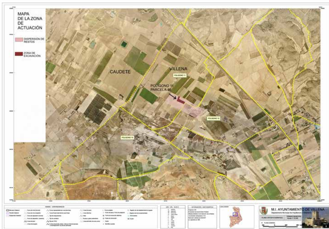
Fig.1. Zona de actuación en las inmediaciones de las Casas del Campo (Villena)

En la partida del Campo existe una red de caminos antiguos que se han interpretado como pertenecientes a un área centuriada cuya extensión sería de unos 700 Ha (Rosselló, 1980: 5-13). Su origen se establece en el siglo I aC según el estudio de los materiales de superficie (Poveda, 1991: 75).