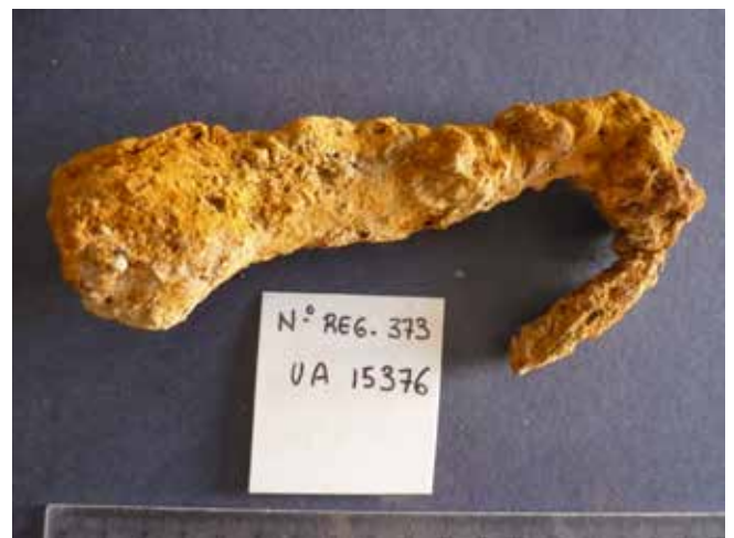
Fig.4. Gancho de garrucha fabricado en hierro. Sondeo II/ UE 4016.