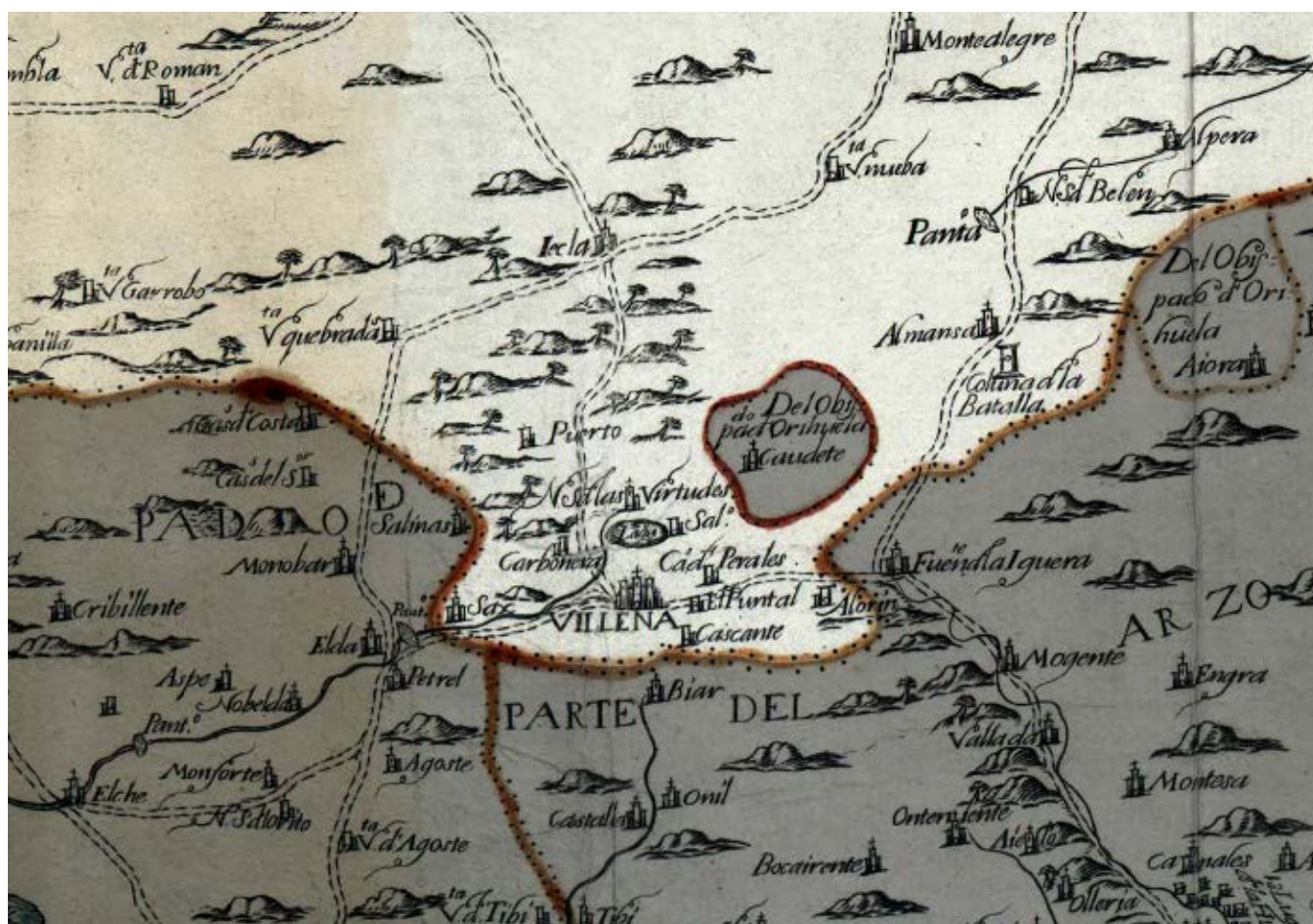
Fig. 2. Villena y sus alrededores. Detalle del Mapa del Obispado de Cartagena de 1724, siendo Intendente General del Reino de Murcia y Valencia, D. Luis Antonio de Mergelina, Caballero de la Orden de Montesa, del Consejo de Su Majestad y Alguacil Mayor perpetuo de la ciudad de Villena. Fuente: Real Academia de la Historia. Biblioteca digital: http://bibliotecadigital.rah.es/dgbrah/es/consulta/registro.cmd?id=12765 . Elaboración: Autores. La parte iluminada corresponde a las poblaciones pertenecientes al Obispado de Cartagena, entre ellas la ciudad de Villena.