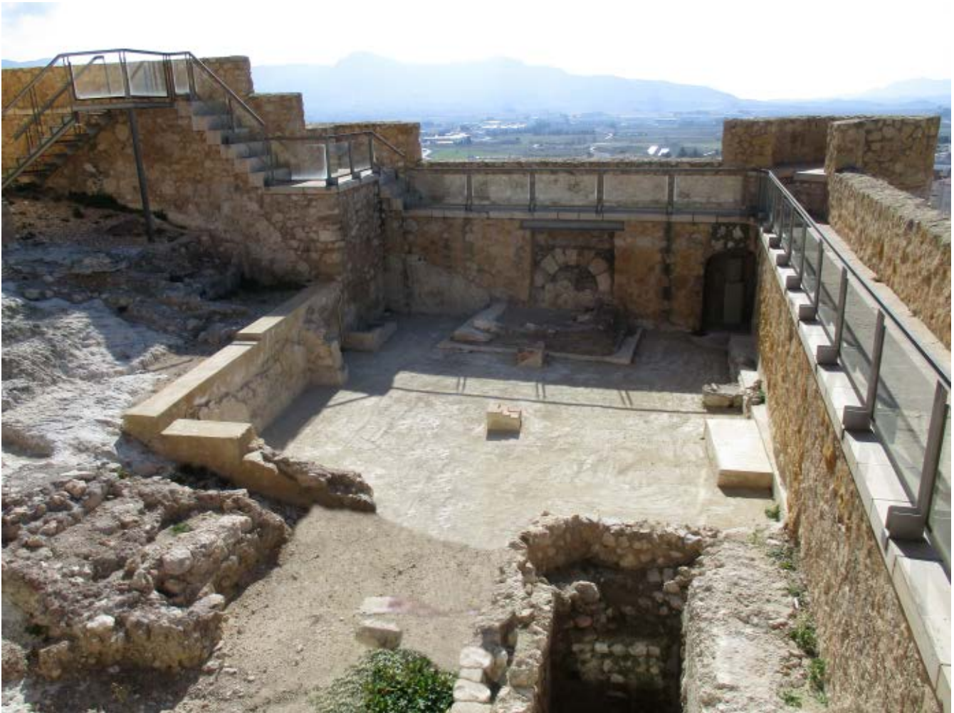
Fig. 5. Vista del espacio ocupado antiguamente por la Ermita de Ntra. Señora de las Nieves, en el interior del recinto fortificado del Castillo de Villena.

Tiene tambien un Oratorio de San Phelipe Neri, un Hospital para enfermos pobres, y recogimiento de Viandantes: un Convento de Religiosos Agustinos; otro de Franciscos Descalzos: otro de Religiosas Trinitarias Calzadas: una Hermita de San Joseph que sirve de Ayuda de Parroquia á la de Santa Maria: otra de San Antonio Abad que los es de la de Santiago; otra en el Castillo que está con Plaza de Armas, foso, y contrafoso, la que antiguamente fue Parroquia; y además de las dichas ocho Hermitas en la Ciudad, y en los Campos, y heredades hay otras muchas.