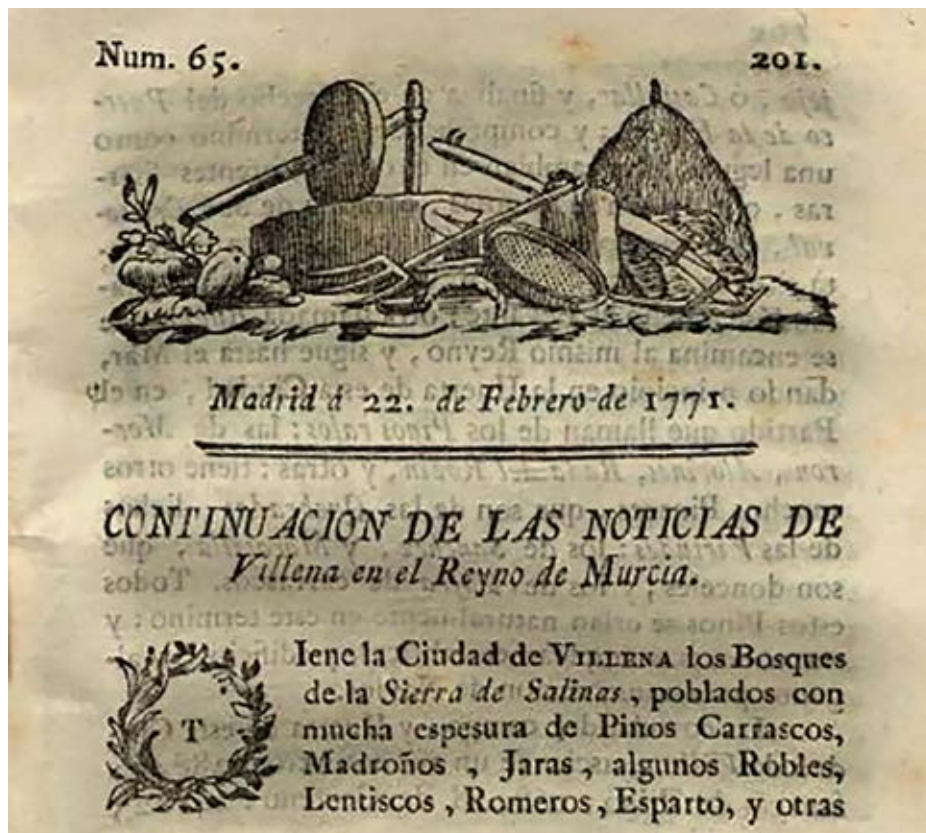
Fig. 3. Portadilla del Correo de España n° 65, con la continuación de las noticias sobre Villena recopiladas por Nipho de Cagjal.