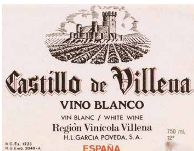
Fig. 6: Etiquetas vinos “Alicantara” y “Castillo de Villena” de las bodegas “Hijo de Luis García Poveda S.A.”.