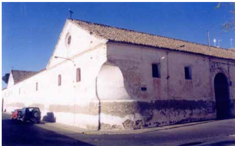
Fig. 1: Antigua bodega de “Hijo de Luis García Poveda S.A.” en el Martillo. Finales años 90.