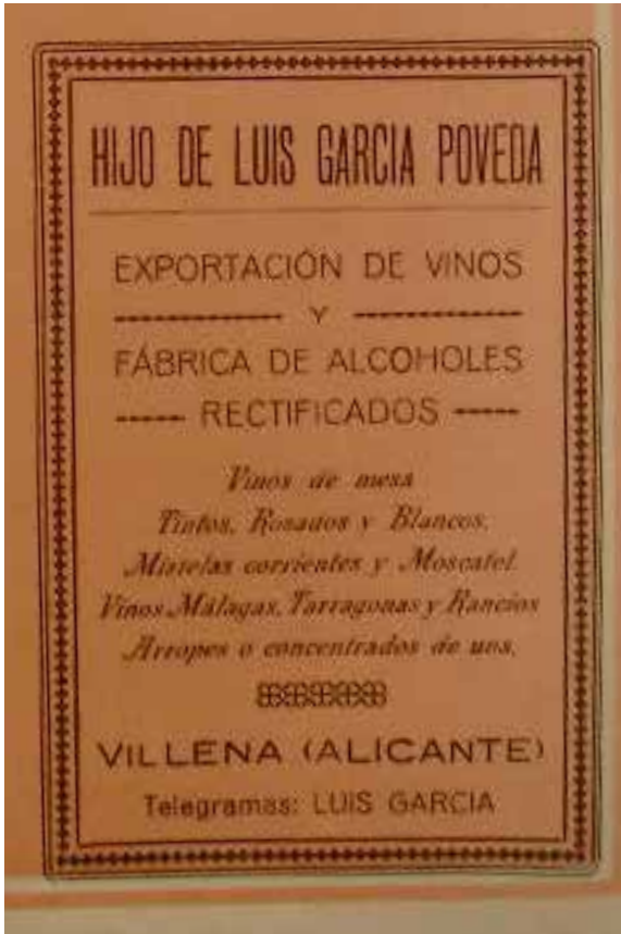
Fig. 3: Anuncio publicitario de la mercantil “Hijo de Luis García Poveda”.

industrias y comercio necesarios a tal fin sobre productos agrícolas ó industriales que constituyen primeras materias para tal objeto o derivadas del mismo.