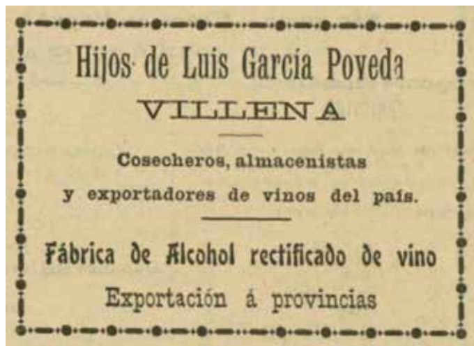
Fig. 2: Anuncio publicitario de la mercantil “Hijos de Luis García Poveda”. Fuente: “Heraldo de la industria”, nº 50 (15-09-1902), p. 11. Madrid.

Fuente: ANV. Año 1894, escritura nº 555, pp. 2480-2485.